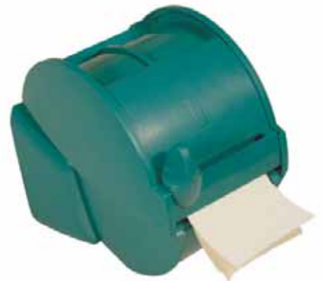
Leikkurilla varustettu sideautomaatti. Saatavana ihonvärisillä tai sinisillä siteillä.