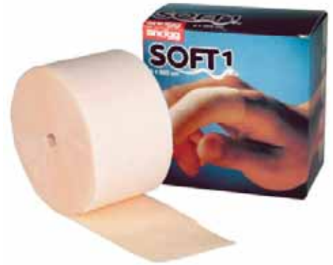
Sidepakkaus, ihonvärinen tai sininen